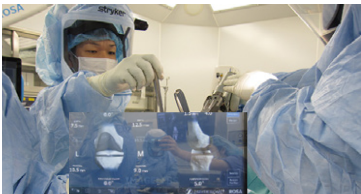
モニターで骨切り量、角度を細かく設定しながら、ロボを用いて人工膝関節置換術を行う筆者。

手術の際には、大腿骨と脛骨にそれぞれ2本のピンを固定し、光学トロッカーと脚に付けられたミニカメラを利用して骨の位置情報を把握し、手術前に計画した情報や手術中の軟部組織の状態など、画面上に表示される数値をみながら、実際に骨を切る量や角度を決定します。